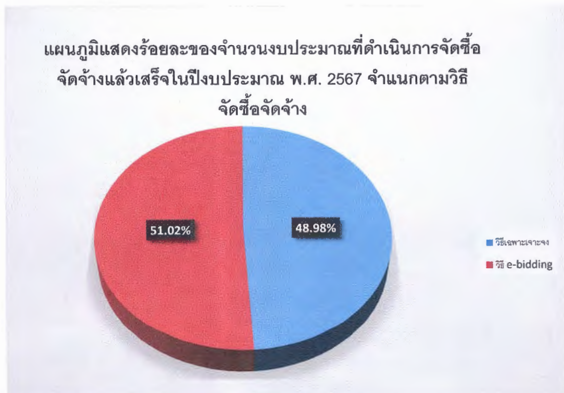
แผนภูมิแสดงร้อยละของจำนวนงบประมาณที่ดำเนินการจัดซื้อจัดจ้างแล้วเสร็จในปีงบประมาณ พ.ศ. 2567 จำแนกตามวิธีจัดซื้อจัดจ้าง

จะเห็นได้ว่างบประมาณที่ใช้ในการจัดซื้อจัดจ้าง โดยวิธีประกวดราคาอิเล็กทรอนิกส์ (e-bidding) นั้นมากเป็นอันดับแรก